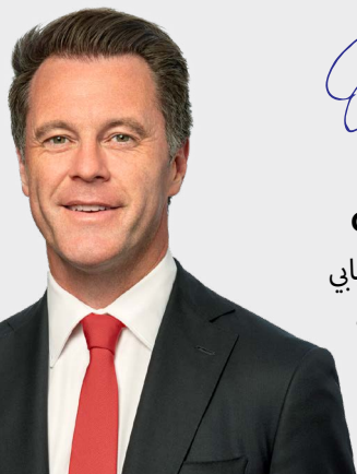
Chris Minns MP

عضو المجلس النيابي رئيس حكومة ولاية نيو ساوث ويلز